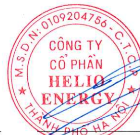
Phan Thành Đạt Chủ tịch Hội đồng quản trị