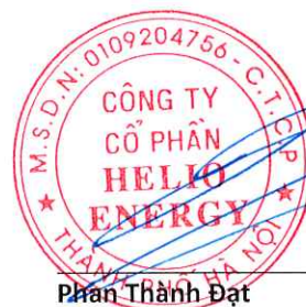
Phan Thành Đạt Chủ tịch Hội đồng quản trị