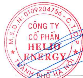
Phan Thành Đạt Chủ tịch Hội đồng quản trị